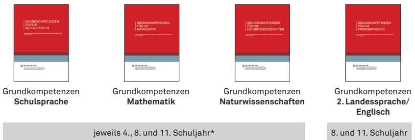
Abb. 1 | Die nationalen Bildungsziele im Überblick

schen Bundesverfassung festgehalten, welche Eckwerte im Bildungswesen harmonisiert sein sollen. Dazu gehören auch die Ziele der Bildungsstufen.